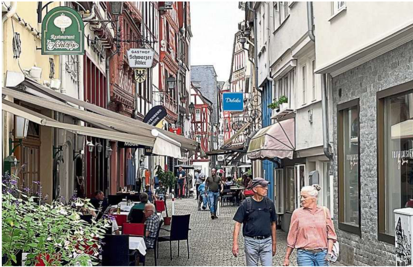
Wunderschön anzusehen, aber wie soll hier in Zukunft geheizt werden? Nicht nur für die Innenstadt gibt es große Aufgaben, auch für die Stadtteile braucht es Wärme Konzepte, die Energie sparen helfen und umweltverträglich sind.

Aber was ist erst einmal der Stand? Bundesweit befasst sich fast jede fünfte Stadt mit der Aufstellung oder Umsetzung der Kommunalen Wärmeplanung (KWP), so das Bundesministerium für Wohnen, Stadtentwicklung und Bauwesen. Das im Januar von der Bundesregierung eingesetzte, strategische Planungsinstrument soll kommunalpolitischen Entscheidern, Bürgern und Wirtschaft in etwa 11.000 Kommunen den Weg vorzeichnen, wie man Wärmeerzeugung und -verbrauch bis 2045 klimaneutral gestalten kann. „Es geht um strategische Lösungen für die gesamte Stadt“, legt die Klimamanagerin Mira Stockmann die Latte hoch. Am Ende soll stehen: mehr Planbarkeit für Hauseigentümer, höhere Unabhängigkeit von Preisent-